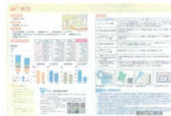
<省エネ事例集> 参加の皆様にはもちろん 差し上げます